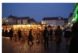
Rynek w Landau